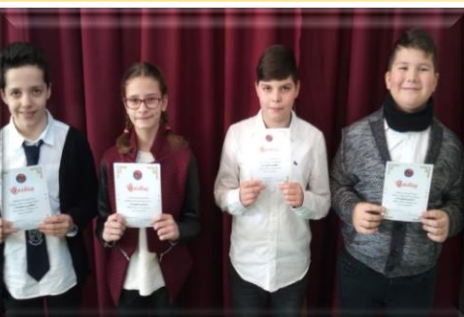
Akikre büszkék vagyunk