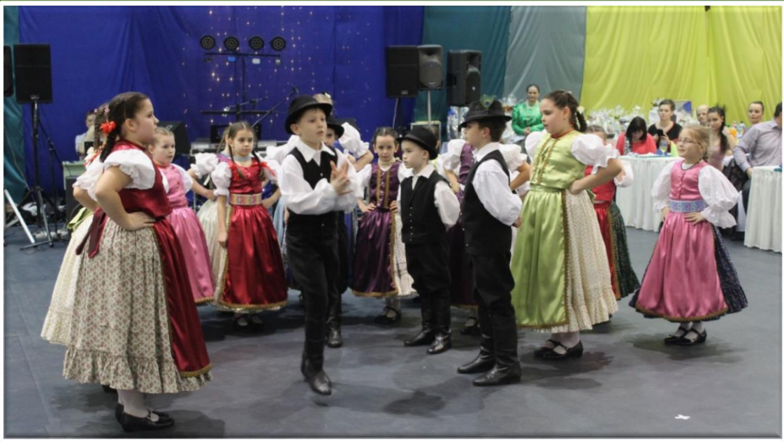
Borbolya néptánc csoport előadása