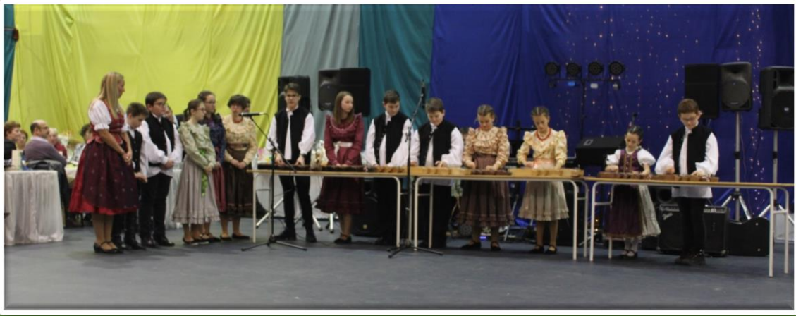
Tekergők néptánc csoport előadása